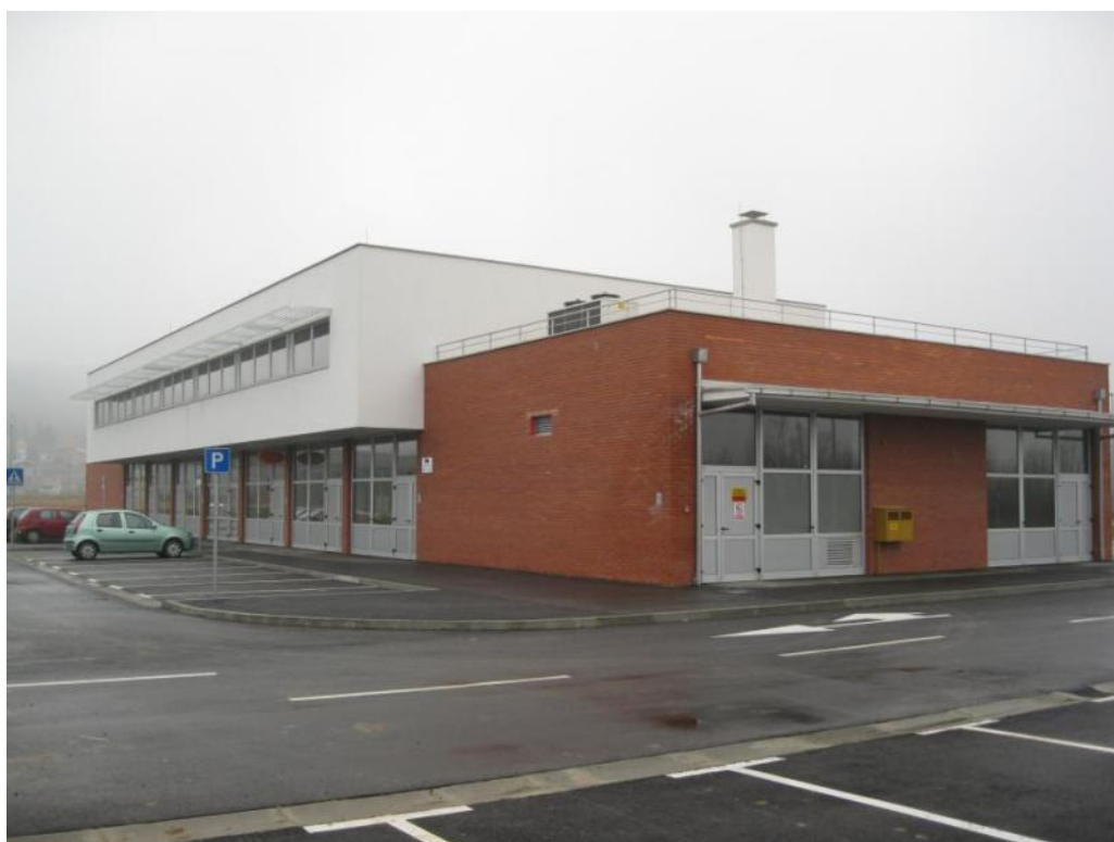
Slika 1. – Poduzetnički inkubator Pakrac

Građevina je smještena unutar Zone male privrede na parceli veličine 6.427 m 2 , uzduž osi sjeverozapad – jugoistok. Tlocrt prizemlja je veličine 57,6 m x 15 m, bruto površine prizemlja od 864 m 2 i bruto površine kata od 622 m 2 . U prizemnom dijelu građevine smješteni su prostori namijenjeni zakupu za proizvodne djelatnosti, ulazni holl s recepcijom, bistro, sanitarni čvor, dizalo, stepenište i kotlovnica u južnom dijelu iznad koje je smještena vanjska jedinica za hlađenje uredskog prostora (kata). Katni dio organiziran je na način da je u južnom dijelu prostor Poduzetničkog centra Pakrac d.o.o. (PCP), u središnjem dijelu je zajednički sanitarni čvor, konferencijska dvorana, informatička radionica, soba za sastanke poduzetnika, a preostali uredski prostor namijenjen je za zakup. Prometna komunikacija unutar parcele izvedena je oko građevine, sa priključcima na prometnice industrijske zone na jugozapadu i sjeveroistoku. Izvedena su 4 niza parkirališnih mjesta sa ukupno 82 parkirališna mjesta, od kojih je 9 za teretna vozila. Preostali dio su zelene površine.